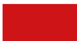
032 Light red Hellrot Rouge clair Jasny czerwony Светло-красный