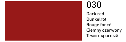
030 Dark red Dunkelrot Rouge foncé Ciemny czerwony Темно-красный