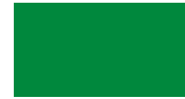
062 Light green Hellgrün Vert clair Jasny zielony Светло-зеленый