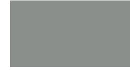
074 ~RAL 7042 Middle grey Mittelgrau Gris moyen Pośredni szary Средне-серый