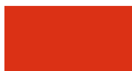
047 Orange red Orangerot Orange rouge Pomarańczowo-czerwony Оранжево-красный