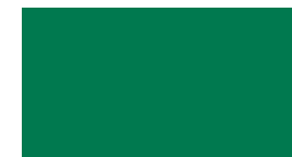
061 Green Grün Vert Zielony Зеленый