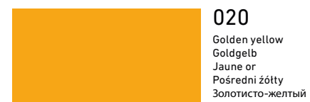
020 Golden yellow Goldgelb Jaune or Pośredni żółty Золотисто-желтый