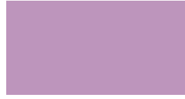
042 Lilac Flieder Lilas Liliowy Сиреневый