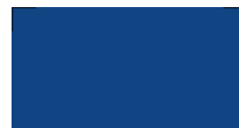
051 ~HKS 44 Gentian blue Enzianblau Bleu gentiane Ciemny niebieski Генциановый синий