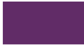
040 ~HKS 34 Violet Violett Violet Ciemny fioletowy Фиолетовый