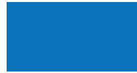
084 Sky blue Himmelblau Bleu ciel Błękitny Небесно-голубой