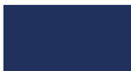
050 ~RAL 5013 Dark blue Dunkelblau Bleu foncé Granatowy Темно-синий