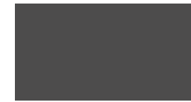
073 ~RAL 7043 ~HKS 92 Dark grey Dunkelgrau Gris foncé Ciemny szary Темно-серый