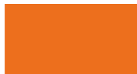
035 Pastel orange Pastellorange Orange pastel Jasny pomarańczowy Пастельно-оранжевый