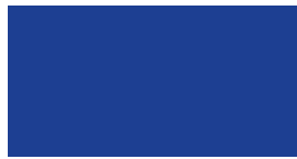
086 ~HKS 42 Brilliant blue Brillantblau Bleu brillant Modrakowy niebieski Ярко-синий