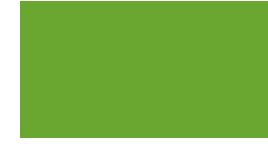
063 ~HKS 66 Lime-tree green Lindgrün Vert tilleul Pastelowy zielony Липово-зеленый