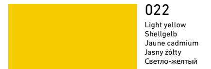
022 Light yellow Shellgelb Jaune cadmium Jasny żółty Светло-желтый