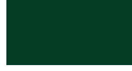
060 ~RAL 6005 Dark green Dunkelgrün Vert foncé Ciemny zielony Темно-зеленый